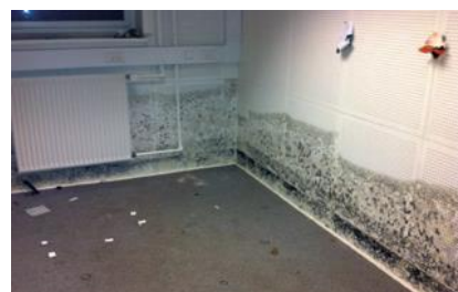
Billede BYG ERFA

Vi har alle maskiner og måleinstrumenter i vort sortiment.